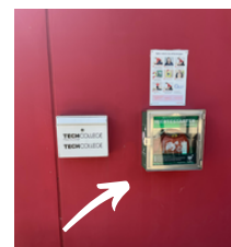
Placeret på nordvestlige gavl ud mod parkeringspladsen